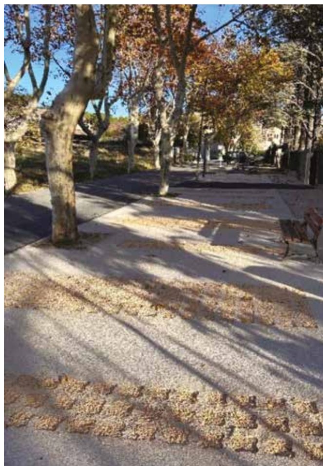
Sur la photo de gauche, on distingue les alvéoles qui seront remplacées après coffrage par du granulat (photo de droite).